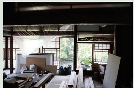
← 写真左に見える白い建物が、店舗入口で増築させていただいた部分。入口までの通路もお楽しみください。