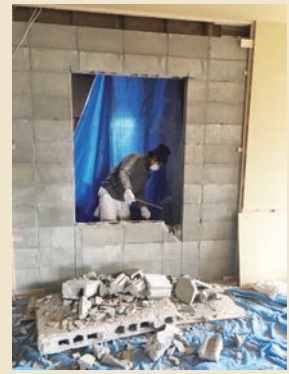
① 出入りする部分のブロック塀を崩す。

「息子が実家に帰ってくるので、増築して欲しい」というのが、今回のご依頼でした。家屋が小屋と併設していたため、住居部分と小屋の隣接するところに新たな部屋を増築させていただきました。