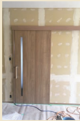
② 増築する部屋と既存住居の床の高さを合わせる。