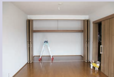
② クローゼット設置、完成。